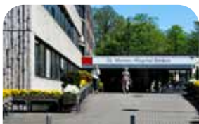
St. Marien-Hospital Borken