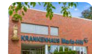
Krankenhaus Maria Hilf Stadtlohn