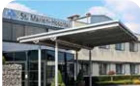
St. Marien-Hospital Vreden