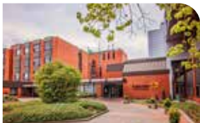
St. Agnes-Hospital Bocholt