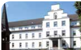
St. Vinzenz-Hospital Rhede