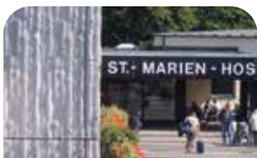
St. Marien-Hospital Borken