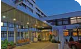
St. Marien-Krankenhaus Ahaus

Nicht zuletzt wollen die Wintercamporganisatoren durch ihre Aktion zukünftige Ärzte für die Standorte des Klinikums Westmünsterland begeistern.