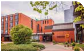
St. Agnes-Hospital Bocholt