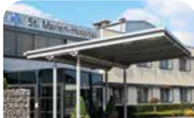
St. Marien-Hospital Vreden