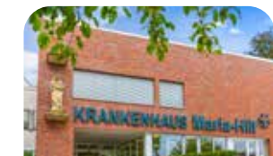
Krankenhaus Maria Hilf Stadtlohn